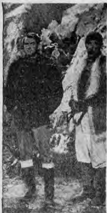
Anthony Quinn está aquí junto a Gregory Peck, el otro héroe de la sensacional película "Los Cañones de Navarone".

Mientras Carl Foreman escribía el guión cinematográfico para su película "Los Cañones de Navarone", notaba que uno de los papeles surgía como hecho especial para un actor al que ni siquiera conocía personalmente, pero cuya actuación había admirado, en extremo. El actor era Anthony Quinn y el papel aquel de Andrea Stavros, individuo gigantesco, en cierta época coronel del ejército griego; cuando su familia fue arrasada por los alemanes, Stavros se unió a los aliados en el movimiento de re-