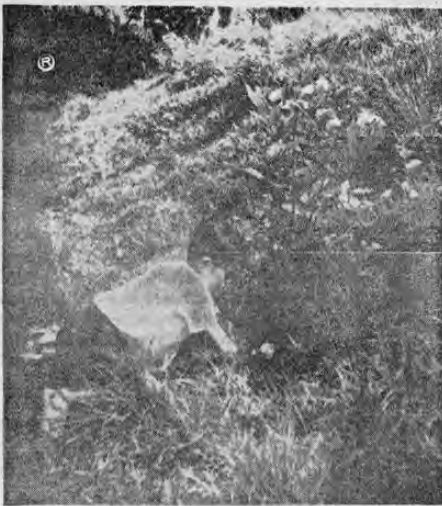
Un distinguido socio 4-S, fotografiado cuando se ocupa de plantar un árbol dentro del plan de reforestación que se lleva a cabo en su zona

Con motivo de la celebración de la VII Semana Nacional de los Clubes 4-S, del 7 al 13 de octubre en curso, este organismo de electrificación de todos los costarricenses, se complace en saludar a los socios 4-S del país, y felicitarlos por la eficiente labor realizada, especialmente por la patriótica obra de reforestación que están llevando a cabo en diferentes cuencas hidrográficas.